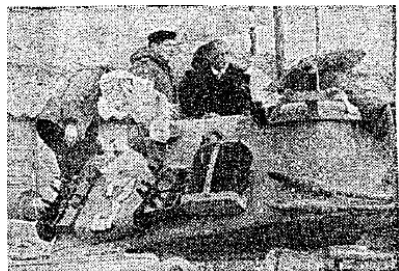
חטוף-בצירות בגין במעלה-אדומים: השילוב הנפלא של ספרד וסייפא

אחר-כך הכניסו את בגין למינה טרור מי שנכתב עליו באותיות מאירוריעניים: מחסן פלוגה ב"י. הכינו שם הצוגה נקה ומגוהגת — מישהו ודאי עשה כאן מסדרים גוספים בלילות האחרונים — שם זוויר לצומו-מקם, אלה קיטבובים, הסביר אחד הקצינים לבגין. אלה מקל" צים. בגין הסתכל במצלמות הטלוויזיה ובמיקרופונים שהקיפו אותו סביב-סביב. כשאני חושב על זה, הגופים היחידים שזוכרים הפוליטיקאים מכל הסיורים לצרכי-העיתונות שהם עורכים, הם אלה של מרצופי שומרי-הראש והצלמים.