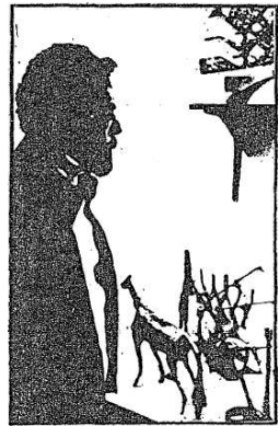
חאמן חיים יחזקאלי ויצירותיו (למעלה)

זה החלל לגמרי במקרה. — איך חיים יחזקאלי, סניח העיזה את ידית ההלחמה, מרים