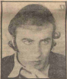
צדוק כל יום לירושלים

"דידינו בירושלים, משתגעים/ כשהם שומ' עם שאננותו חיים בשתי קוביות בנות 23 מ"ה, ומשתגעים פעם נוספת. כשהם באים לבקרנו ורואים שזה לא גורא כל-כך..." וא לא גורא — אך גם לא קל. עד היום אין במעלה-אדומים חנות-מכולת והכל של להביא