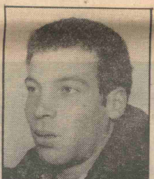
אורי חתונה של החבר'ה