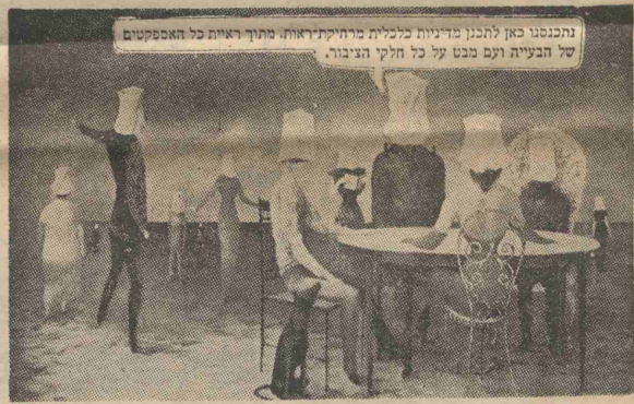
תכנסנו כאן להכנין מדיניות כלכלית מרחיקת-ראות. מתוך ראיית כל האמקפטים של הבעיה ועם מנט על כל חלקי הציבור.

יבדכך אלהים ויסיפך כוח וירוממך ויעש דעותיך חרצות, ויתן בלב ידון עצה, וימנע לגנדו ויפן שמך בכל הארץ וידכה לגוי גדול