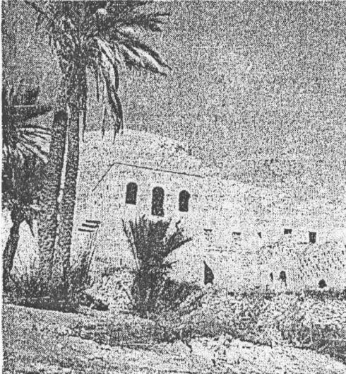
המובנה בעיןקלט, בו מצויה טחנת הקמח החדשה

צליליה של הכירה מרחבה זו ניתן לראות שירידי אמת מים קדומה, המתנשאת לגובה של יותר מ'30 מטר. בקרבתה בניו אבו ג'ול ולירדו עצי דקל. בניו זה שיש בעבר מכתת קפה, אשר נדוגה ב' כוח המים הזורמים בוואדי. אל ג'ול לאורך הגלל זאמת המים הקיימת בכיוון מורה ג'יע אל בקעה יריחו. בדרך נעובר את מבוג מר ג'יריס, המצוד לכתלו של החל ה' קניוני, לירוחו מגור, החדשים בצור' תל ובקיימון, ניתן להניע באמצעות הדרך הירומית, שאותה אשר, לה' מוש' במעלה ארזותים. שילוש טוב המצויה במסעפים השונים שבמעלה ארזותים יתנה אוחנו לכל אהר מן ה' מקומות הנוגרים. מקנה עקריים — נקודה שגואה במדבר ירודה, המחתיח הדרך שבין ירושלים ליריחו, מעלה עקריים — דרך קדומה של עוברי אורח, שילוח מסחר, לגיונות צבא. דרך שטופת הלמות מרחות והלומת שקשוק וחלילי שירין, לפני מחוה מחמש שנים רי' קט כאן טור משורין ירדני שחש שילוחיה, לפני פחות מחמש שנים היו כאן משלוח אויב מצרעיים, ש' נוספו בבגלת פתע. גויות השירין החרוד מונו זה מכבר, למיטלטים כמעט שאין עוד ככר. מהמורות הכבדים הרחב והטוב בשתל, בעצדי הכביש שנתלו שלטו מ' ל' חקירה וטליות עוצרים מ' ל' את, מלון השומרוני עוצרים מ' ל' מונג כאן לירדת לאוקי קלט ול' מיניו מורבים, נצפים כאן לשתתף בשתאות על צליליה המרשימה של עוצרת שחקקה על בעת הדבר, הרוכבות אשור שעור מ' ל' יעצרו כאן מלון להביט במנומם וכעריבילי שפון וסועלים צרובי ששב ובלום המיין מים אל תביה הראשונים של יירוח' שלים הגדולה.